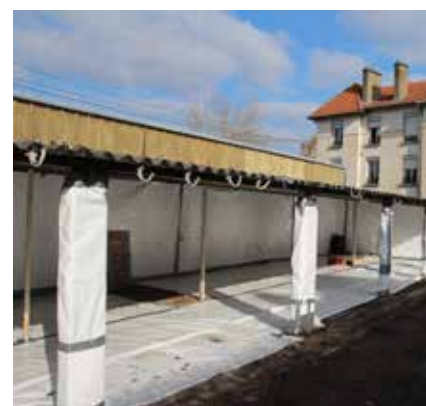
Les travaux de démolition du Quartier Gentil à Sarreguemines ont démarré. La phase de désamiantage est amorcée et devrait se poursuivre encore quelques semaines.