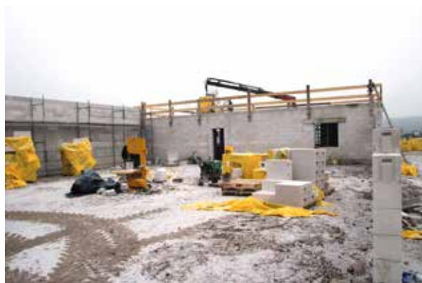
Construction d'un hangar au Golf Sarreguemines Confluences. Il servira au stockage et à la maintenance du matériel d'entretien du terrain ainsi que de vestiaires pour le personnel travaillant en extérieur par tous temps.